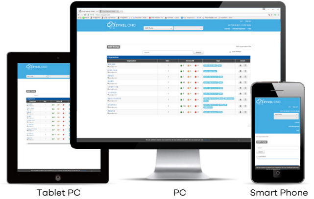
[ Zyxel Ally Service 플랫폼 ]

클라우드 플랫폼 서비스를 적용하여 관계자가 다양한 단말기 (PC, 태블릿, 스마트폰)로 어디서든 실시간 모니터링이 가능합니다.